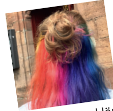
Fotografiere Haare, Hände oder Gesichter (Zustimmung erfragen!)