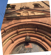
Entdecke die Welt der Religionen!