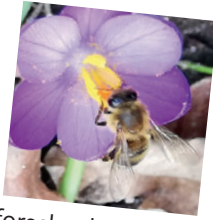
Erforsche die Welt der Tiere und Pflanzen!