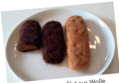
Aachener Printen, gefilzt aus Wolle

Versuche doch, deine „Besonderheit“ zu basteln. Sei kreativ und entscheide dich für geeignete Materialien. Du kannst z. B. mit Bausteinen, Verpackungsmaterialien, Papier, Ton, Wolle oder Naturmaterialien bauen. Besprich deine Pläne mit einem Erwachsenen und lass dich bei der Wahl und dem Besorgen der Materialien unterstützen.